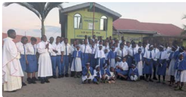
Pasteur con alumnos de un colegio al que atiende.

«Mi abuelo me inculcó el amor por la Santa Misa. Sentía un gran respeto y afecto por los sacerdotes, que lo visitaban con frecuencia. Ese trato cercano despertó en mí un amor profundo por la Iglesia y el deseo de ser sacerdote. El día de mi ordenación fue una gran alegría para él».