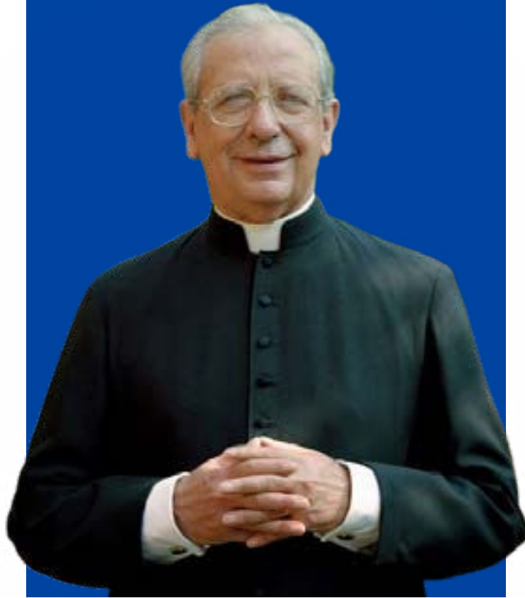
Beato Álvaro del Portillo