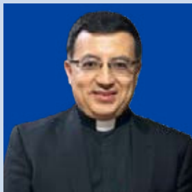
Simón Bolívar Sánchez Carrión

En 2025, fue ordenado obispo un exalumno de Pamplona que también lo es de Roma. Otros tres fueron nombrados obispos, pero serán ordenados en 2026.