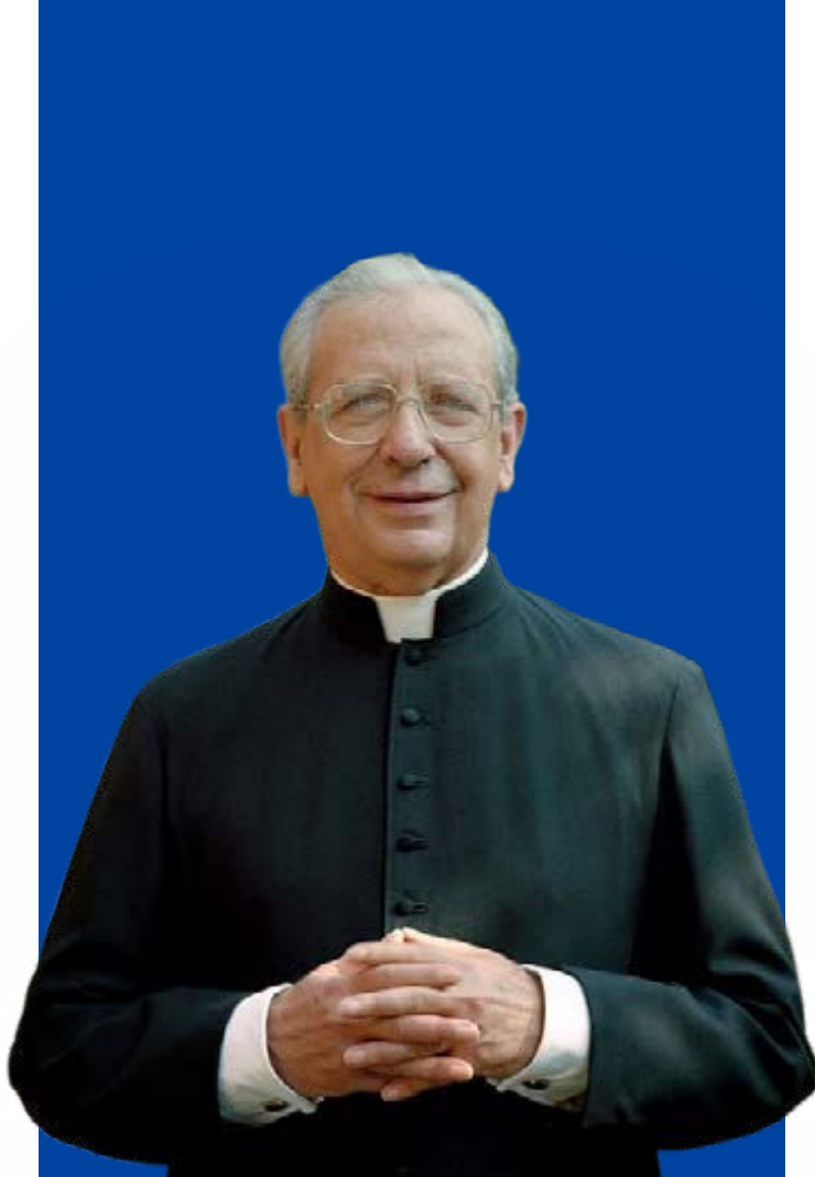
Beato Álvaro del Portillo