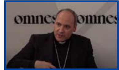
“La integración de los grupos eclesiales en la vida parroquial, con el obispo de Alcalá, entre otros”.

Otras temáticas del año recibieron a expertos que se centraron en la arquitectura sagrada del siglo XXI; el matrimonio en occidente desde un punto de vista jurídico; los retos, riesgos y oportunidades de la vida afectiva del sacerdote; y sobre el diálogo interreligioso como camino de fraternidad.