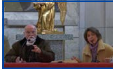
“La paternidad espiritual del sacerdote, con el sacerdote y religioso Jacques Philippe”.