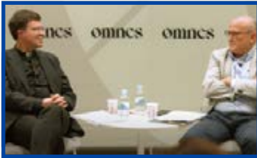
“Benedicto XVI, la fe y la razón, con el profesor Pablo Blanco, premio Ratzinger 2023”.

Durante todo el año la Fundación CARF patrocinó el Foro Omnes que sirvió para conocer temas de actualidad y a expertos de distintas materias, y para incentivar el trato entre benefactores y amigos de la Fundación.