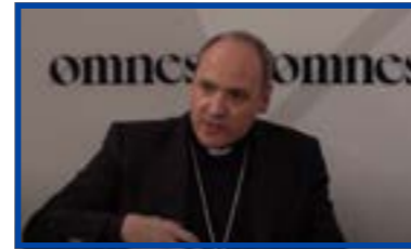
“La integración de los grupos eclesiales en la vida parroquial, con el obispo de Alcalá, entre otros”.

Otras temáticas del año recibieron a expertos que se centraron en la arquitectura sagrada del siglo XXI; el matrimonio en occidente desde un punto de vista jurídico; los retos, riesgos y oportunidades de la vida afectiva del sacerdote; y sobre el diálogo interreligioso como camino de fraternidad.