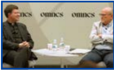
“Benedicto XVI, la fe y la razón, con el profesor Pablo Blanco, premio Ratzinger 2023”.

Durante todo el año la Fundación CARF patrocinó el Foro Omnes que sirvió para conocer temas de actualidad y a expertos de distintas materias, y para incentivar el trato entre benefactores y amigos de la Fundación.