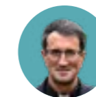
Ramón (Raimo) Goyarrola Nombrado obispo de Helsinki (Finlandia), el 29 de septiembre.

Desde 1989 se han ordenado 134 obispos y arzobispos, y tres fueron creados cardenales.