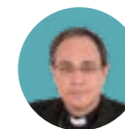
Teodoro León Muñoz Nombrado obispo auxiliar de Sevilla (España), el 27 de mayo.