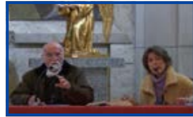
“La paternidad espiritual del sacerdote, con el sacerdote y religioso Jacques Philippe”.