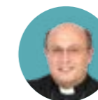
Francisco José Prieto Nombrado arzobispo metropolitano de Santiago de Compostela (España) el 3 de junio.