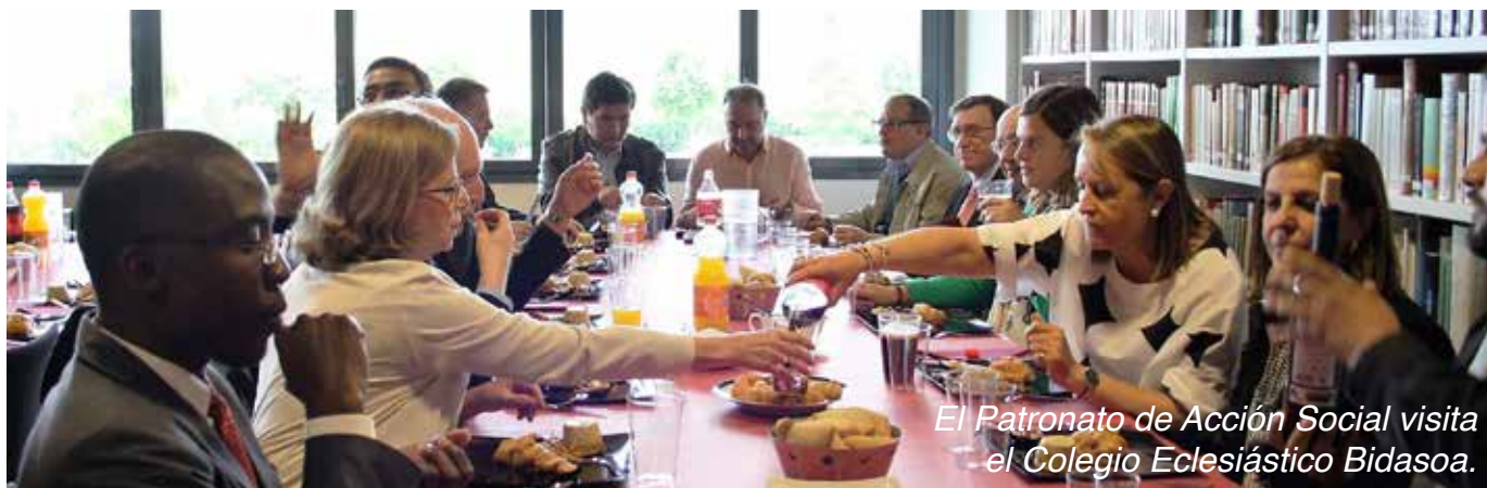
El Patronato de Acción Social visita el Colegio Eclesiástico Bidasoa.

Las personas que quieran participar o deseen donar objetos para el mercadillo, pueden ponerse en contacto: 659 05 73 20 / 659 37 89 01