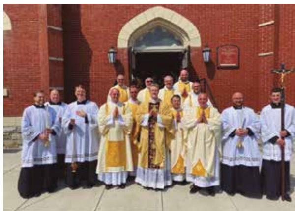
D. Peter tras la santa Misa en la parroquia de la diócesis de Harrisburg.

Lee la historia completa en www.carfundacion.org